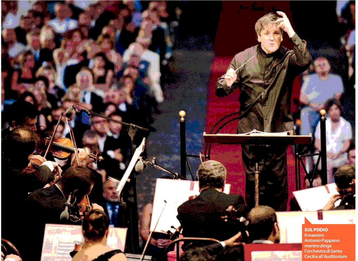
SUL PODIO Il maestro Antonio Pappano mentra dirige l'orchestra di Santa Cecilia all'Auditorium